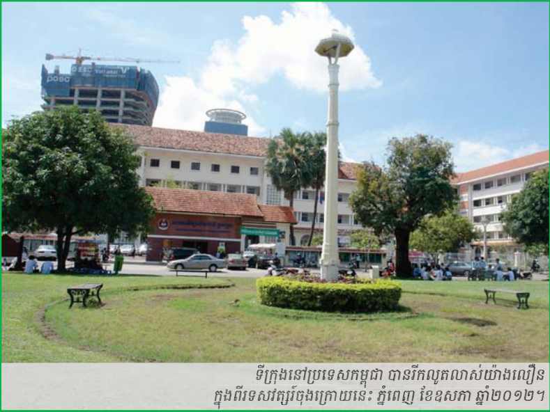
ទីក្រុងនៅប្រទេសកម្ពុជា បានរីកលូតលាស់យ៉ាងលឿន ក្នុងពីរទសវត្សរ៍ចុងក្រោយនេះ ភ្នំពេញ ខែឧសភា ឆ្នាំ២០១២។

លោក Ban Ki-moon អគ្គលេខាធិការនៃអង្គការសហប្រជាជាតិ បាននិយាយថា មនុស្សជាតិ បានឈានចូលដល់សតវត្សរ៍ទីក្រុងហើយ។ ប្រជាជនលើពិភពលោកជាង ៥០% រស់នៅក្នុងតំបន់ទីក្រុង។ តាមការប៉ាន់ស្មាន តួលេខអ្នករស់នៅតំបន់ទីក្រុងនៅអាស៊ីអាគ្នេយ៍ នឹងកើនដល់ ៧៣% នៅឆ្នាំ២០៥០ (UN-HABITAT 2008: 12)។ ការផ្លាស់ប្តូរយ៉ាងគំហុក នៃកន្លែងរស់នៅរបស់មនុស្សនេះ ផ្តល់ឱកាសដល់ការសំខាន់នៃទីក្រុង ក្នុងការអភិវឌ្ឍសេដ្ឋកិច្ចពិភពលោក។ កន្លែងទីក្រុង ជាចំណុចស្នូលនៃឧស្សាហកម្មហើយបណ្តាញទីក្រុង គឺជាប្រព័ន្ធខួរក្បាលនៃសេដ្ឋកិច្ចពិភពលោក។ លំហទីក្រុងនៅកម្ពុជាជាច្រកចេញចូលកាន់តែសំខាន់ឡើង ទៅកាន់បណ្តាញសេដ្ឋកិច្ចក្នុងតំបន់ និងពិភពលោកដែលសំខាន់បំផុតក្នុងការជួយសម្រួលវិនិយោគ និងពាណិជ្ជកម្មឆ្លងកាត់ប្រទេស។ តំបន់ទីក្រុងនៅកម្ពុជា មានប្រជាជនកើនឡើងយ៉ាងលឿន ក្នុងអត្រាប្រចាំឆ្នាំជាមធ្យម ៤,៣៤% ពីឆ្នាំ២០០០ ដល់ ២០១០ (World Bank 2012)។ ពិតមែនតែនគរូបនីយកម្មតែងផ្សារភ្ជាប់ទៅនឹងការអភិវឌ្ឍ វាក៏តែងមានវិសមភាព និងភាពខ្វះខាតផងដែរ ហើយកម្ពុជាដែលស្ថិតក្នុងចំណោមប្រទេសមាន អត្រាភាពក្រីក្រនៅទីក្រុងកម្រិតខ្ពស់បំផុតនៅក្នុងតំបន់ ក៏ជួបបញ្ហានេះដែរ។ អន្តរាគមន៍ទាន់ពេលវេលារបស់រដ្ឋាភិបាល គឺចាំបាច់បំផុត ដើម្បីញ៉ាំងឲ្យនគរូបនីយកម្មវាបម្រើឲ្យគ្រប់គ្នា មានចីរភាព អាចហុចផលចំណេញបានច្រើនបំផុត និងបានទៅដល់គ្រប់ស្រទាប់សង្គម។ ដោយផ្អែកលើទស្សនៈខាងលើ ឯកសារនេះពិនិត្យពិចារណាទីនៃតំបន់ទីក្រុងក្នុងការអភិវឌ្ឍប្រទេសកម្ពុជា ធ្វើការវាយតម្លៃពីបញ្ហាប្រឈមនានាពាក់ព័ន្ធនឹងកំណើនតំបន់ទីក្រុងទៅថ្ងៃខាងមុខ ព្រមទាំងកំណត់ពីគោលនយោបាយសំខាន់ៗដែលត្រូវមាន ដើម្បីដោះស្រាយបញ្ហាទាំងនោះ។ នៅផ្នែកខាងចុងនៃឯកសារនេះ មានការគូសបញ្ជាក់ពីកំណើនតម្រូវការកម្មវិធីស្រាវជ្រាវដ៏សកម្មមួយ ពីតំបន់