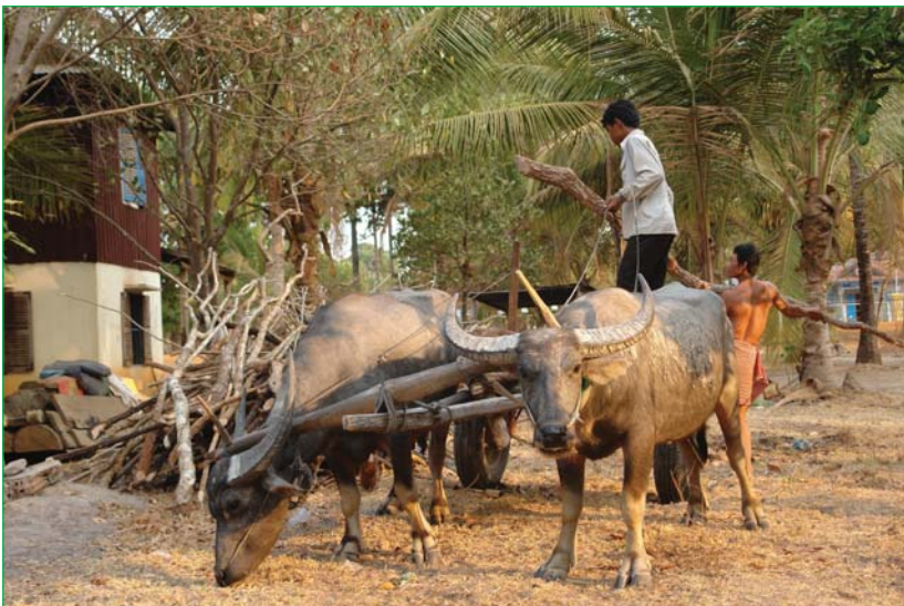
កសិកររើអុសចុះពីរទេះនៅភូមិជនបទមួយ ក្នុងខេត្តកំពង់ឆ្នាំង

ក្នុងប៉ុន្មានឆ្នាំកន្លងមកនេះ វិបសអ-CDRI បានផ្សព្វផ្សាយរបាយការណ៍ស្រាវជ្រាវ និងឯកសារពិភាក្សាមួយចំនួនស្តីពីភាពក្រីក្រ និងវិសមភាពនៅកម្ពុជា ហើយឯកសារចុងក្រោយបំផុត គឺការសិក្សាពីការចាកផុតភាពក្រីក្រ (Moving Out of Poverty Study: MOPS) ។ ១ MOPS បានប្រើវិធីសាស្ត្រខុសពីវិធីសាស្ត្រតាមទំលាប់ ប៉ុន្តែជាទូទៅបានផ្តល់លទ្ធផលប្រហាក់ប្រហែលគ្នា ។ MOPS និងការសិក្សាផ្សេងទៀតដែលធ្វើឡើងដោយ CDRI និងស្ថាប័នដទៃទៀត ២ បានបង្ហាញភស្តុតាងដ៏ច្រើនថា អ្នកក្រនៅកម្ពុជាទទួលបានផលចំណេញមិនបានច្រើនដូចក្រុមចំនួនដទៃទៀត ពិសេសសេដ្ឋកិច្ចស្នូលវិសេសរបស់កម្ពុជា នៅទសវត្សរ៍ចុងក្រោយនេះ ។ ដូចលទ្ធផលរកឃើញផ្សេងៗទៀតរបស់ CDRI ជាពិសេសការសិក្សាចំនួនពីរ ស្តីពីការចុះបញ្ជីដីដែលទើបចប់សព្វគ្រប់ ៣ ការសិក្សានេះក៏បានរកឃើញពីកំណើនវិសមភាពដែរ ។